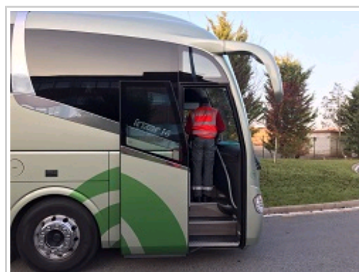
Comprobando autorizaciones administrativas

En cuanto al balance del año pasado se detectaron y denunciaron nueve infracciones, ninguna de ellas de gravedad, que se remitieron al Servicio de Transportes para comunicación a las empresas e inicio de expediente.