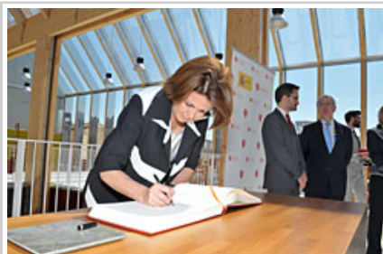
Barcina Lehendakaria Espainiako Pabiloiko ohorezko liburuan sinatzen.