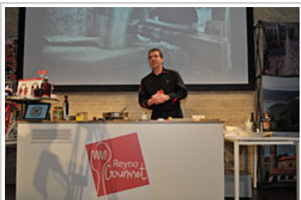
Alex Múgicaren erakustaldi gastronomikoa.