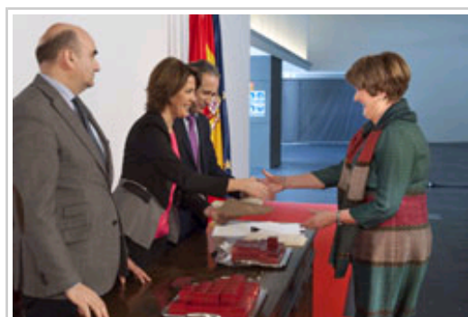
Una jubilada recibe la insignia y el diploma.