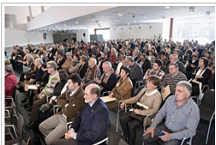
Asistentes al acto.