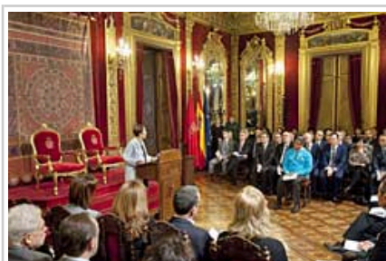
Barkos Lehendakariaren agerraldia.