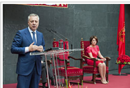
Blanco ministroa eman duen mintzaldian