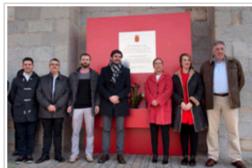
Las autoridades e invitados, junto a la placa.

A lo largo de los siglos, el edificio ha tenido distintos fines representativos y hoy, tras la restauración dirigida por Rafael Moneo, alberga los fondos del Archivo Real y General de Navarra .