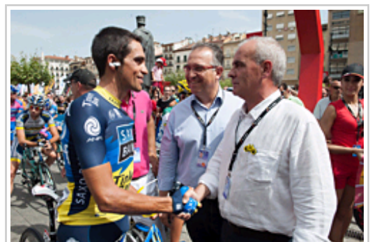
El consejero Pejenaute saluda al ciclista Alberto Contador, en presencia del alcalde Maya.