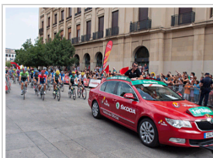
Momento del inicio de la segunda etapa de la Vuelta a España, en la Plaza del Castillo de Pamplona.