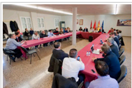
Vista general de los asistentes a la reunión celebrada en Fustiñana.