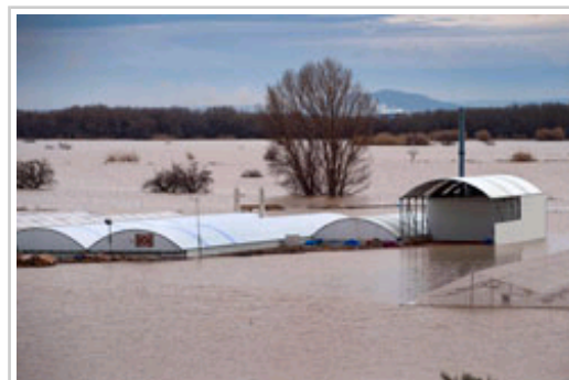
Explotación agropecuaria inundada en Fustiñana.