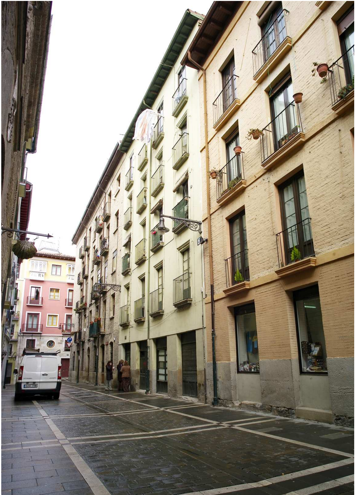
Fachada del inmueble