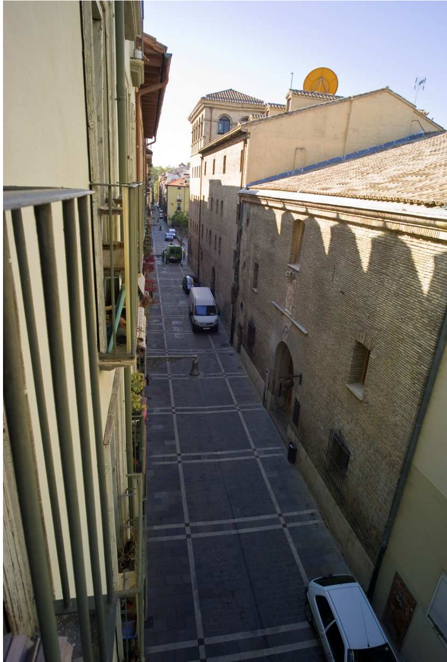
Vistas desde balcón