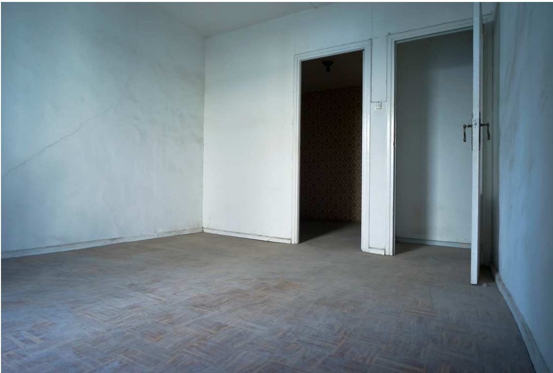
Interior de las viviendas