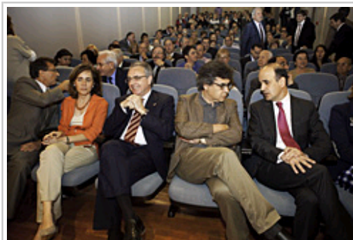
"Nafarroa, etorkizunerako gonbitea" liburuaren aurkezpenera bertaratutakoak.

Liburua Nafarroako sistema politiko eta instituzionalari buruzko laburpen batekin amaitzen da, eta urtaro bakoitzean kontuan hartu beharreko eta merezi duten Nafarroako hitzordu garrantzitsuenen inguruko ohar batekin.