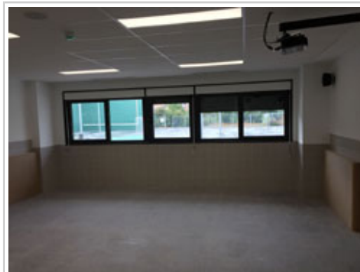
Una de las aulas de nueva creación del CP J.Lizarraga.

En el día de hoy, se ha realizado la recepción parcial de las obras correspondientes a la FASE I, ampliación del CP Joakin Lizarraga, por lo que las tres nuevas aulas se van a poder utilizar desde el comienzo del curso 2018/2019.