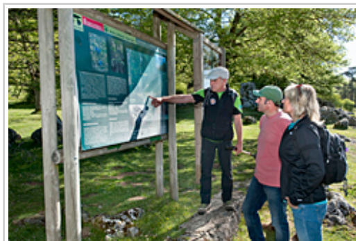
Ayerdi lehendakariordea eta Ezkutari zuzendari orokorra gidariaren azalpenak entzuten.

Ibilaldia maiatz, ekain, irail eta urriko asteburu guztietan eta uztail eta abuztuko astearte, ostegun eta larunbatetan egingo dira. Santiago bideko etapak zazpi larunbatetan egingo dira, maiatzetik urrira bitartean. Bestalde, ibilbide luzeak (GR) ekain, irail eta urriko hiru larunbatetan egingo dira.