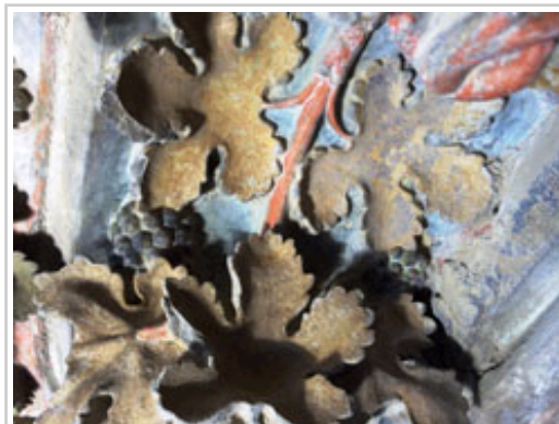
Fatxada garbitu ondoren, mahatsondoek, haritzek eta pikondoek kolorea berreskuratu dute.

Abendu eta urtarril artean aldamera 200 pertsonak baino gehiagok bisitatu zuten larunbatetako doako bisita-programan, Ondare Historikoko Zerbitzuko teknikarien laguntzarekin bertan izan diren ikasle nahiz espezialisten taldeez gain.