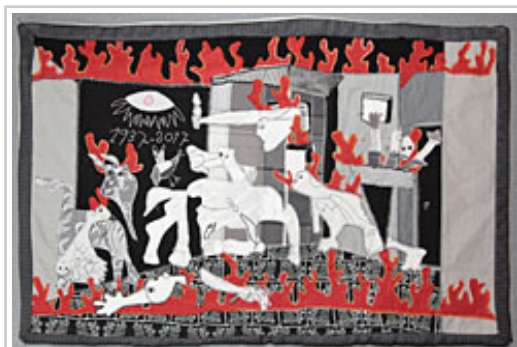
“Mi Gernika”, una de las obras.