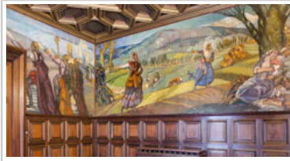
Representación de la zona de Baztan