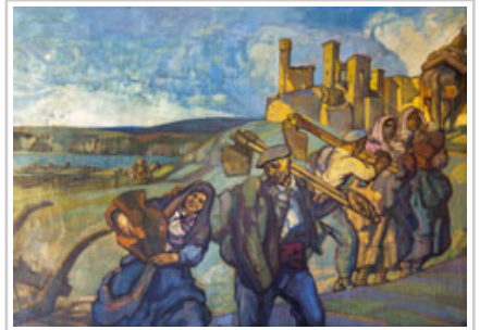
REpresentación de la Zona Media.