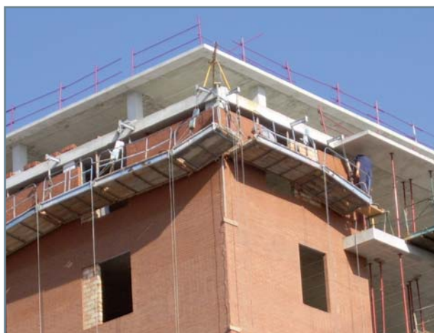
Peligrosa instalación de un andamio colgado.