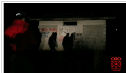
Pintadak kentzen, Arbizun.