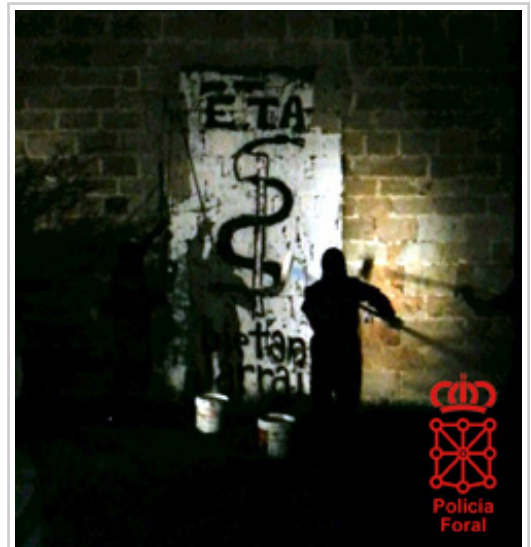
Arbizon, Nafarroako Gobernuak kontratatutako langileek ETArekin aldeko pintada bat kentzen.

Segurtasun-indarrek –Polizia Nazionala, Guardia Zibila eta Foruzaingoa– ez dute aipamen terroristak egiten dituzten garrantzizko beste pintada edo pankartarik hauteman. Hautemanaz gero, txostena aurkezten dute beren administrazioaren aurrean, eta azken hori dagokion udalari gogoratzeaz arduratzen da, hau da, epe bateko epean haiek garbitu edo kentzeko duen legezko betebeharrak.