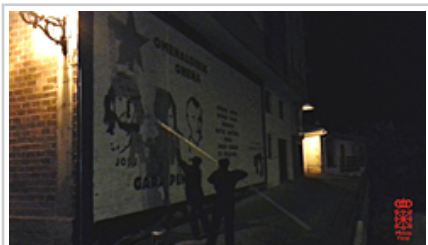
Pintadak kentzen, Etxarri-Aranatzen.