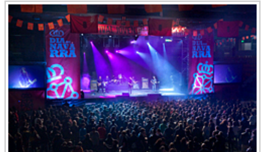
Nafarroaren Egunaren Gazte Jaialdian bertaratutako ikusleak.

Aldiz, Burlatako kultur etxean abenduaren 3an egindako Nazioen Jaialdian Nafarroan dauden beste herrialde batzuetako hamar elkartetako 120 artistak esku hartu zuten, eta 450 pertsona bildu ziren bertan.