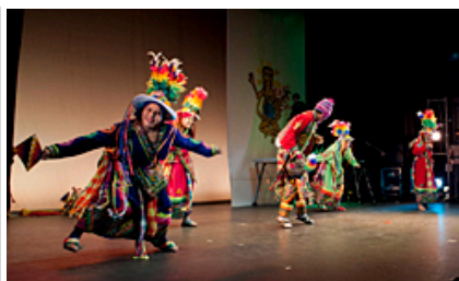
Nazioen Jaialdiko talde latinoamerikarretako bat.