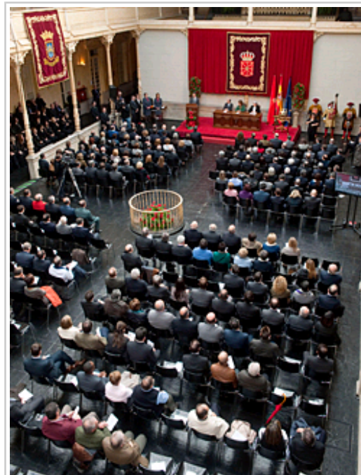
Nafarroako Urrezko Domina NUPari emateko ekitaldian izandako ikusleen ikuspegia.

Azkenik, 300 pertsona joan ziren Foruzaingoak Los Arcosko ikastetxe publikoko pilotalekuan antolatu zuen ateak zabatzeko egunera . Bide-segurtasuneko haur-parke bat ere jarri zen bertan.