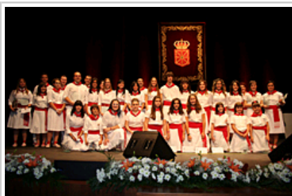
"Tuterako Hiria", Nafarroako Foru Komunitatea Saria, josten 5. lehiaketako finalistak.