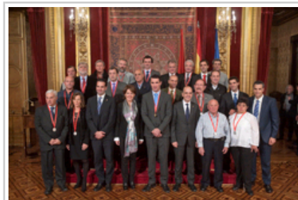
Lehendakaria eta beste agintari batzuk sarituekin Kirol Merezimenduaren dominak emateko ekitaldian.