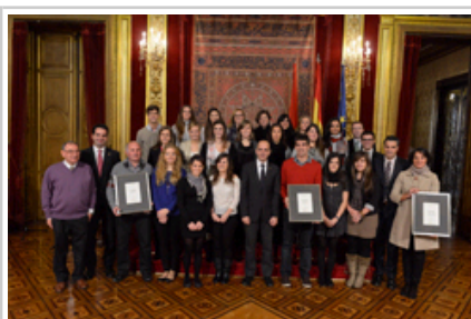
Alli kontseilaria Gazteria Saria jasotako erakundeetako ordezkariekin.