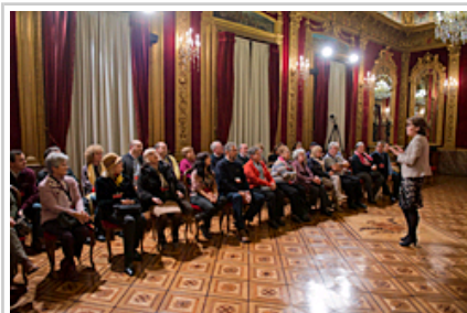
Lehendakaria Nafarroako Jauregia bisitatu zuten herritar-talde bati harrera egiten.