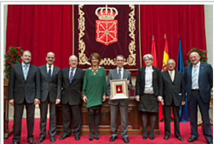
Nafarroaren Urrezko Domina NUPari ematen.