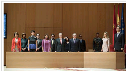
Printze-printzesak ekitaldiko mahaiaren buru izan dira