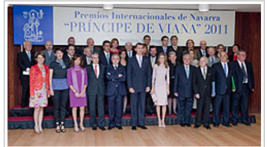
Berorren gorentasunen amaierako taldeko argazkia sarituekin, gaur eman diren hiru sarietako epaimahaikideekin eta ekitaldian izan diren agintariekin

Gaueko bederatzia aldera, berorren gorentasunek Nafarroako Lehendakaria agurtu eta handik joango dira.