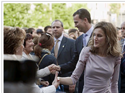
Felipe de Borbón jauna eta Letizia Ortiz andrea Baluarteren kanpoaldean elkartu diren herritarrak agurtzen