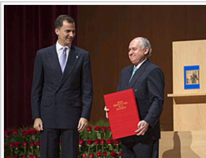
Manuel Elkin Patarroyo Elkartasunaren Vianako Printzea Saria jasotzen