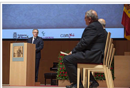
Sanz Lehendakaria, sarituen aurrean egin duen mintzaldian