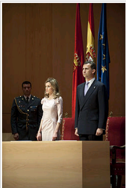
Berorren gorentasunak, ekitaldiaren hasieran