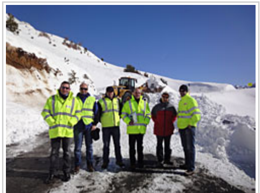
Responsables del Departamento han visitado la marcha de los trabajos de limpieza del puerto.

Por este motivo, desde el mediodía una retroexcavadora y una turbofresadora están trabajando para despejar la nieve depositada en la calzada y poder abrir la carretera, que actualmente se encuentra cerrada desde la venta de Juan Pito, en las próximas horas. En los primeros momentos de limpieza de los restos de los dos aludes, que afectan a 200 metros de la calzada, se han encontrado restos de barreras de protección de la carretera, ramas de árboles y balizas de nieve.