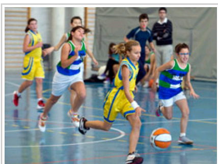
Gaur jokatutako saskibaloia-partida bat.