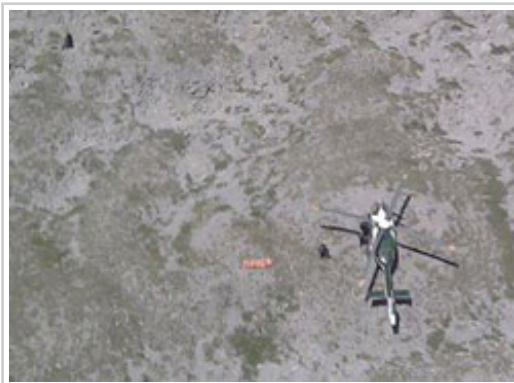
Un helicóptero junto a la camilla con uno de los cuerpos.

La ANE activó ayer, jueves, la búsqueda en el Pirineo roncalés de dos personas, un varón de 40 años y una mujer de 37, domiciliados en Vizcaya, de los que no se tenía noticia desde el martes. Los excursionistas salieron de su alojamiento en Isaba con intención, al parecer, de ascender al pico Anie, y no regresaron. Tampoco lo hicieron el miércoles, fecha en la que tenían previsto dejar la habitación, por lo que los propietarios del establecimiento alertaron a los familiares, y éstos, al 112-SOS Navarra. El coche de los montañeros fue encontrado el jueves en el aparcamiento del collado de Ernaz, en la frontera, punto de partida de las rutas más habituales para acceder al Anie.