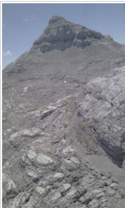
El pico Anie.