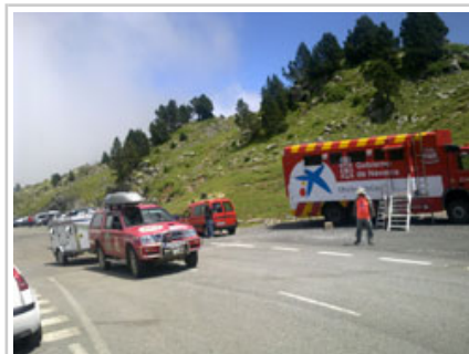
El vehículo de la unidad canina y el puesto de mando avanzado de la ANE, en el collado de Ernaz.