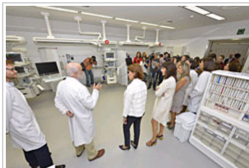
La Presidenta Barcina, en la sala de reanimación del edificio de Urgencias del CHN.

El control de todos estos espacios se realiza desde tres puntos: control del circuito de leves, del circuito de graves, y control central - sala de médicos. En este último se puede hacer un seguimiento en tiempo real tanto de cada caso (hora de ingreso, patología, gravedad, ubicación, tipo de atención), como del estado de ocupación de cada espacio asistencial. Desde este punto, además, se puede acceder, mediante pantallas de alta resolución, a las imágenes de las pruebas radiológicas y a los monitores de la