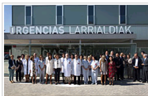
La Presidenta Barcina y autoridades, en el exterior del nuevo edificio.

El nuevo edificio, que aglutina todas las urgencias de adultos que se prestaban en el Hospital de Navarra y Virgen del Camino, incluye otras novedades como la existencia de dos circuitos diferenciados para pacientes leves y graves, una sala de observación con 16 habitaciones individuales y dos más para aislamiento y custodia, salas reservadas para duelo, información o pacientes psiquiátricos, una sala de descontaminación, un escáner y ecógrafo propios, y un helipuerto en la azotea.