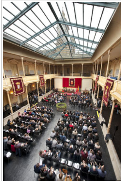
Klaustro isabeldarraren ikuspegia ekitaldiaren une batean.