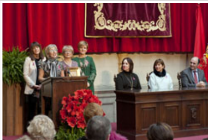
Sarayren ordezkarien agerraldiaren une bat.