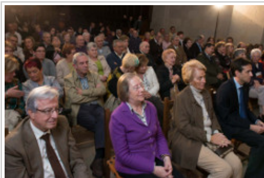
Liburuaren aurkezpenera gerturatu diren pertsonen argazkia.

Idazleak monasterioaren historia azaltzen du. Besteak beste, honako gaiak aztertzen ditu: zenobioaren sorrera, monasterioaren eraikuntzaren testuingurua, zistertarren krisia XIV. mendean Erregelaren gehiegizko lasaikeriaren ondorioz; bere berpizkunde material, espiritual eta artistikoa Aro Modernoan; egonkortasunaren mendeak (XVII eta XVIII), desamortizazioarekin izandako galerak eta zistertar arauen berreskurapena. Ibilbide historikoa egungo komunitatearen inguruko informazioarekin ixten du idazleak: 21 fededunek osatzen dute eta euren bizimodua ateratzeko hegazti-granja batean, ostatu batean, te pastak egiten eta erlauntz batean lan egiten dute.