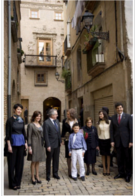
Almirantearen Etxearen aurrean