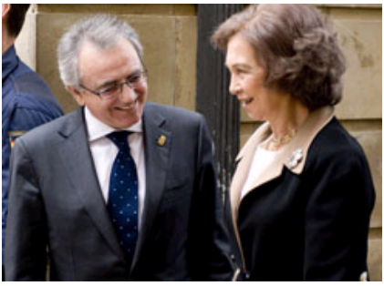
Sanz Lehendakaria berorren maiestatea agurtzen