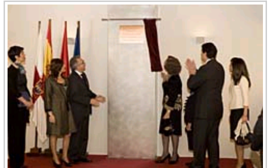
Berorren maiestate Sofia Erregina Almirantearen Etxera egin duen bisitaren oroipen plaka desestaltzen