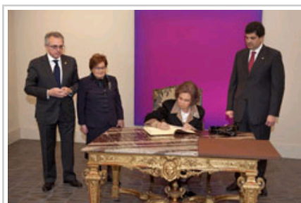
Fundazioaren omenez liburua