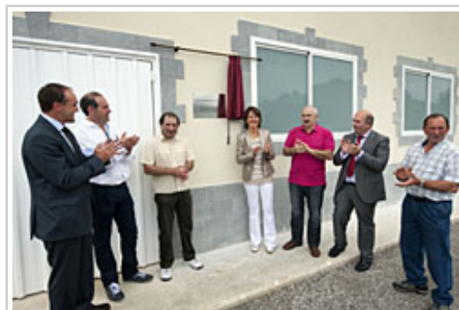
Barcina Lehendakaria eta agintariak, oroigarritzko plakaren alboan.