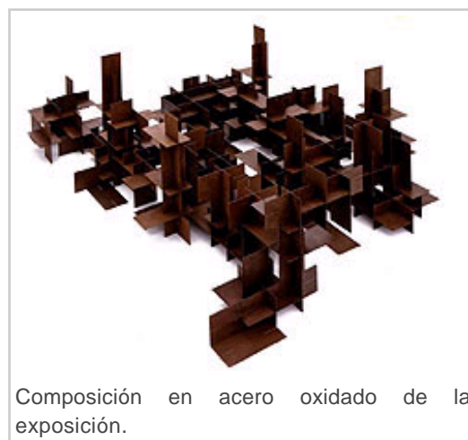
Composición en acero oxidado de la exposición.

establecer una dinámica constructiva, susceptible de producir infinidad de resultados formales concretados en óleos encerados sobre tela de algodón de refinada factura, y en obra tridimensional que se comenzó a materializar a partir de 2006. El desarrollo volumétrico de la serie ha permitido producir dos tipos de estructuras. Una de ellas resulta del ensartado de planchas de acero; y la otra, igualmente en acero, surge de la interrelación combinatoria de siete volúmenes surgidos de la descomposición del cubo.