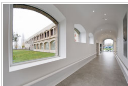
Uno de los pasillos del centro.