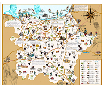
Mapa del Destino Hemingway.