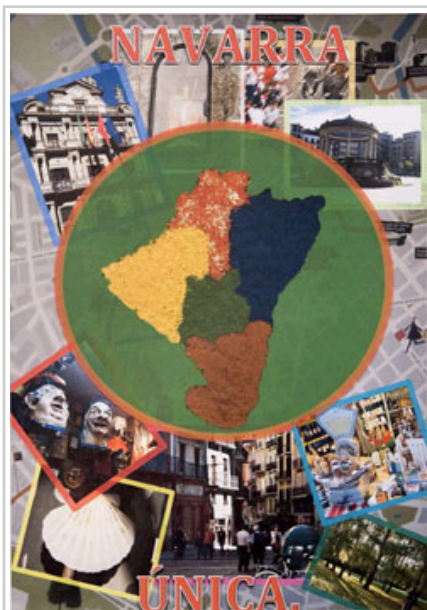
DBHko 3. eta 4. mailako lehen saria.