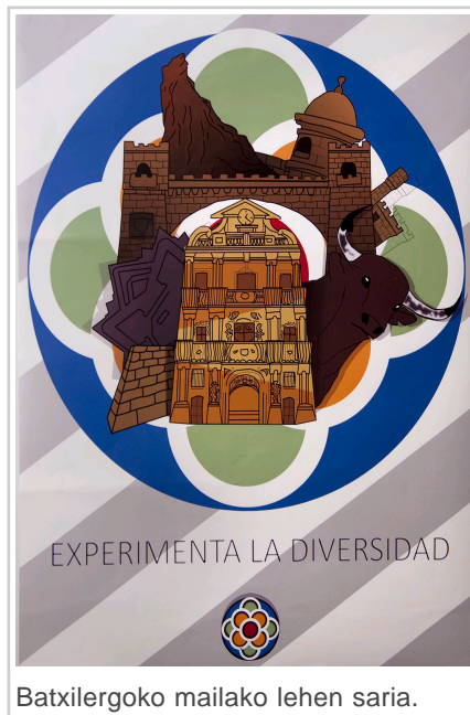
Batxilergoko mailako lehen saria.