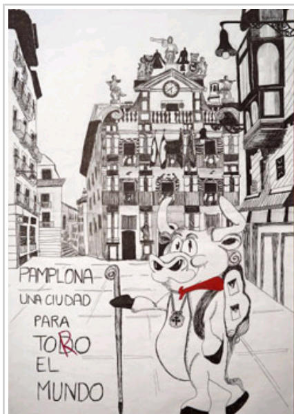
DBHko 1. eta 2. mailako lehen saria.