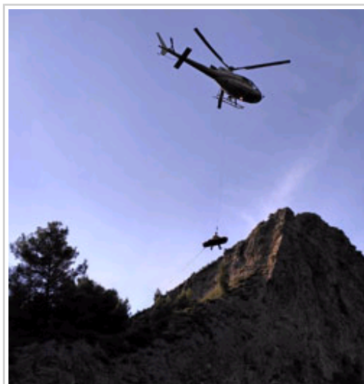
Evacuación del accidentado.

El herido ha sido transferido al helicóptero medicalizado, que esperaba posado en un campo y que ha completado el traslado hasta el Complejo Hospitalario de Navarra.