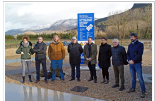
Argazki oina informazioaren bukaeran.

Bestalde, Sevillak “mankomunitateak Lizarraldearen garapen estrategikorako landutako inplikazio handia aipatu du, eta horrek esan nahi du etorkizunari begira iraunkortasuna eta ingurumenarekiko zaintza oso presente dituela”. Ildo horretan,