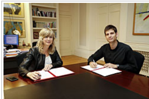
Lankidetzeta-hitzarmena sinatzeko unea.

onartu zen 2016ko azaroaren 23ko Legeari atxikitako Ekintza Planean bildutako betebeharraren arabera, Nafarroako Gobernuak era koordinatuan lan egin behar du Foru Komunitatean esplotazio sexualerako emakumeen salerosketaren arloan diharduten bestelako erakundeekin. Zehazkiago esanda, 2018rako programazioaren barnean, hainbat neurri abiaraziko ditu emakumeen aurkako indarkeriaren adierazpen honen prebentzioan eta arretan aurrera egiteko; besteak beste, arreta emateko eta leheneratzeko ostatu-baliabide espezifiko baten sorrera.