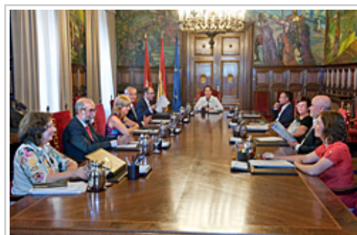
Nafarroako Gobernuak saio batean elkartuta.