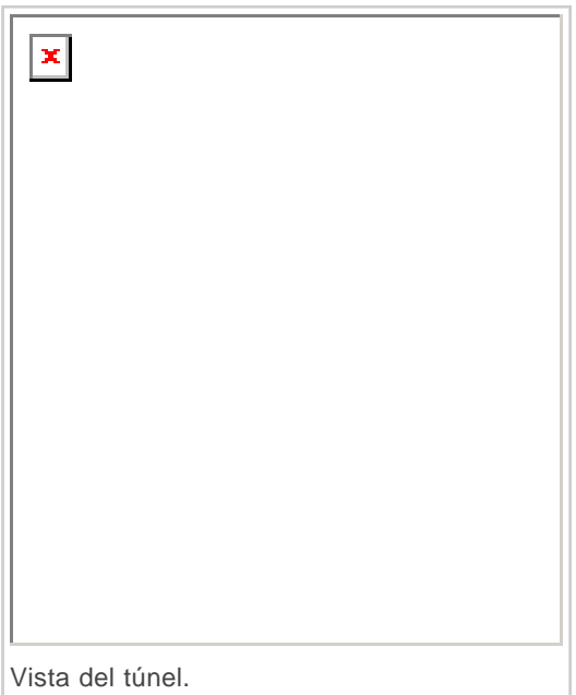
Vista del túnel.

Los trabajos de reparación de la infraestructura han sido realizados por las empresas Construcciones Mariezcurrena, que ha acometido la reconstrucción de la estructura, y SICE S.A. encargada del desmontaje y la retirada del material dañado por el incendio, así como de la reparación de todos los sistemas