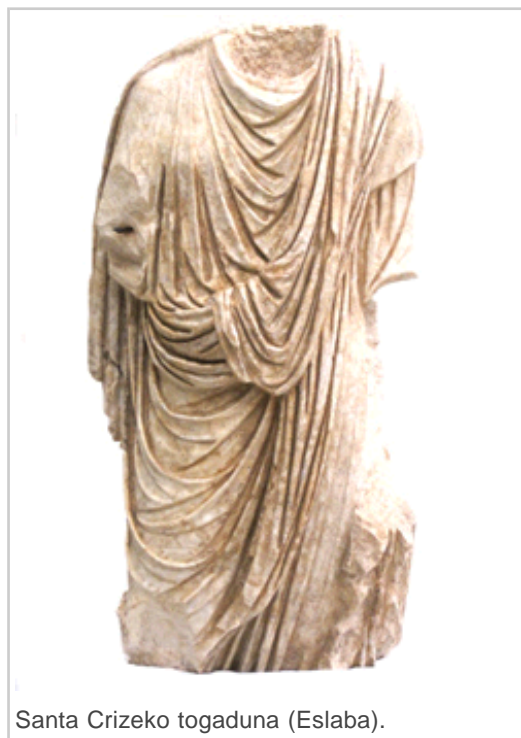
Santa Crizeko togaduna (Eslaba).

Funtsak osatzen dituzten material arkeologikoen inguruan kontsultak egin ditzakete ikerlariek eta interesa dutenek. 2013an 43 kontsulta egin ziren, horietatik 4 luzeak (doktorego-tesietarako edo lurraldeaz gaindiko ikerketa-proiektuetarako). Aldi baterako erakusketak egiteko eta Nafarroako museoetako erakusketa iraunkorrak berritzeko ere balia daitezke.