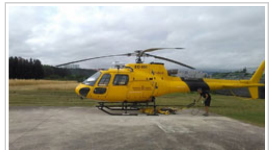
Preparativos en el helicóptero desde el que ha sido localizado el extraviado en Itoiz.

Sobre las 19 horas la sala de gestión de emergencias de SOS Navarra ha sido informada de que una persona había caído por una pared de roca, resultando lesionado en una pierna, y que se encontraba agarrado a un saliente con riesgo de precipitarse. Al tratarse de un lugar hasta el que no se podía acceder con vehículos, ha sido movilizado un helicóptero del Gobierno de Navarra que ha trasladado al herido, una vez inmovilizado en una camilla, hasta donde esperaba la ambulancia medicalizada en la que ha sido evacuado al Complejo Hospitalario de Navarra.