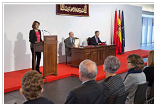
Barcina Lehendakaria ekitaldira bertartutakoei hitz egiten.

510 omenduetatik, 288 emakumeak dira eta 211 gizon. Haietatik, 209 Osasun-arloari atxikita zeuden, 188 Hezkuntzari, 105