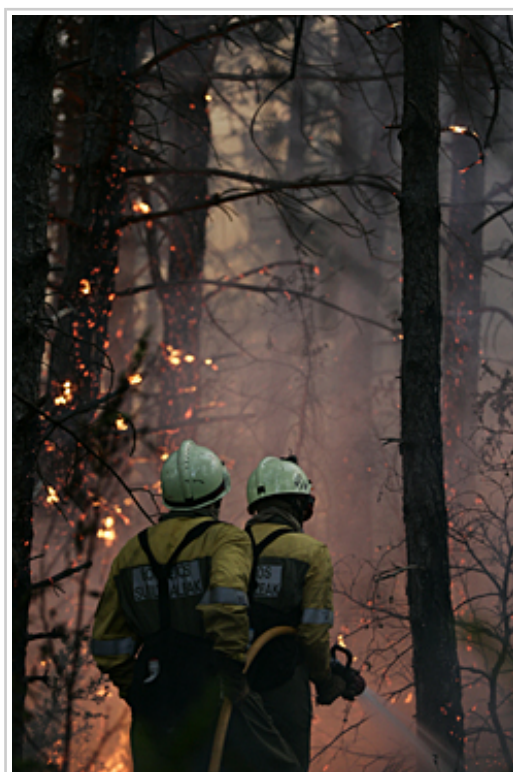
Bi suhiltzaile aurreko basoko sute bat itzaltzeko lanetan.

Bestalde, Landa Garapen, Ingurumen eta Toki Administrazio Departamentuak kanpainan laguntza-lanak egingo dituzten teknikariak