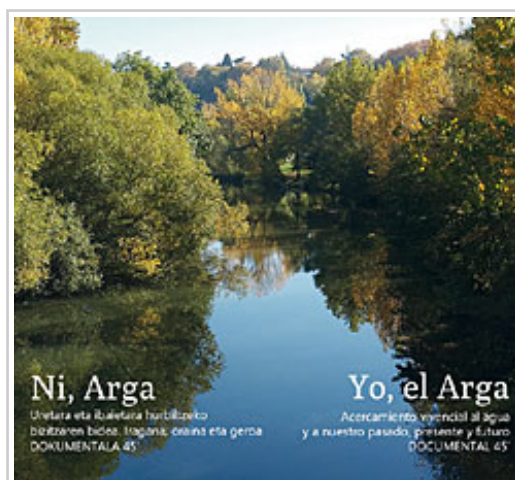
Imagen del documental "Yo, el Arga. Ni, Arga".

El Departamento de Desarrollo Rural, Administración Local y Medio Ambiente ha editado el documental “Yo, el Arga. Ni Arga”, un relato en primera persona de la vinculación e influencia del río en las gentes que habitan sus orillas, con una mirada al pasado, al presente y al futuro de los territorios que recorre, desde su nacimiento en Alduides, pasando por Esteribar, la comarca de Pamplona, Arazuri, Puente la Reina, o Funes, y su desembocadura en el río Aragón.