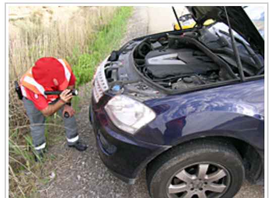
Un agente de la Policía Foral inspecciona un vehículo durante la campaña de control.

Por su parte, en cuanto a las condiciones del alumbrado, la Policía Foral ha controlado su correcto funcionamiento, que no deslumbrasen las luces de cruce y el uso del alumbrado entre la puesta y la salida de sol y en condiciones de visibilidad reducida.