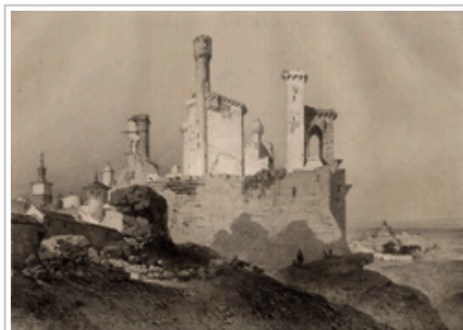
1850eko Erriberriko jauregiko litografia.

Zehazki, gerra karlistei buruzko testigantza asko daude, esaterako: Hirugarren Gerra Karlistaren ikuspegia irudikatzen duen marrazki bat, Iruña edo Lizarrako bistak, eta baita "Galería Militar Contemporánea"-tik ekarritako jeneral nahiz pertsonalitate karlista eta liberalen erretratu asko ere. Karlismoari buruz, oso interesgarriak dira ere, Hirugarren Gerra Karlistan Iparraldeko fronteko operazio militarrei buruzko xehetasunak deskribatzen dituzten orri kartografikoak. 1869tik 1876ra bitarteko Gerra Karlistako kontakizun militarreko atlas topografikoan jasotzen dira (Gerraren Gordailuak argitaratutakoa).