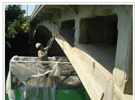
Ledeako zubiaren konponketa-lanak.