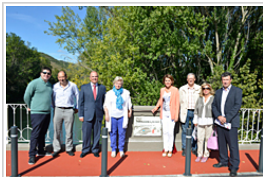
Barcina Lehendakaria eta Zarraluqui kontseilaria inguruko herrietako alkateekin Ledeko zubian.

Zubia sendotu eta konpontzeko lanak, nagusiki, zubi-pilarearen (zuzenean