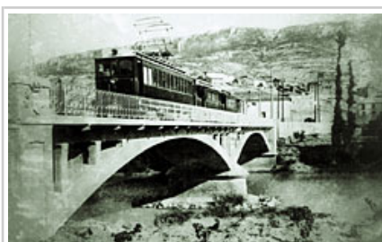
Lehenko Irati tranbia, Ledeako zubia zeharkatzen.