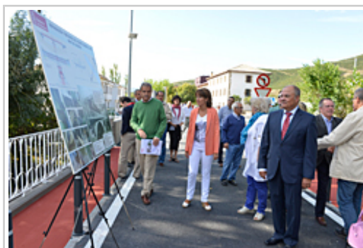
Barcina Lehendakaria zubian egindako lanen laburpenari begira.