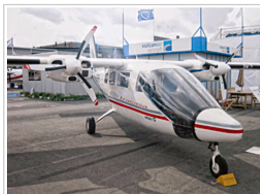
Avión empleado para obtener la ortofotografía.

La producción y el control de la ortofotografía ha sido realizada por el Departamento de Fomento con la colaboración del Instituto Geográfico Nacional. Para obtener las imágenes, se han empleado un avión y una cámara de última generación, las 14 estaciones permanentes de la Red de Geodesia Activa de Navarra y una infraestructura informática que permite procesar una gran cantidad de información en plazos breves. Estos trabajos han sido desarrollados por la empresa pública Tracasa.