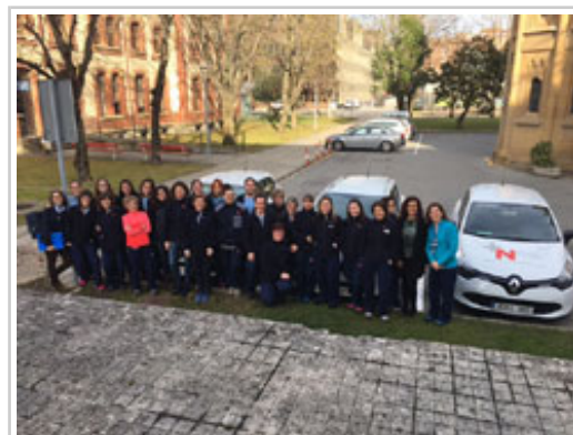
Nafarroako Ospitaleguneko etxeko ospitalizazioen taldea.

2017ko lehen seihilekoan 2.048 ospitalizazio gertatu dira guztira (1.547 Ospitalegunean, 323 "Reina Sofía" ospitalean eta 178 "García Orcoyen" ospitalean), eta 16.903 egun eman dira. Batez beste 8,2 egun egon dira.