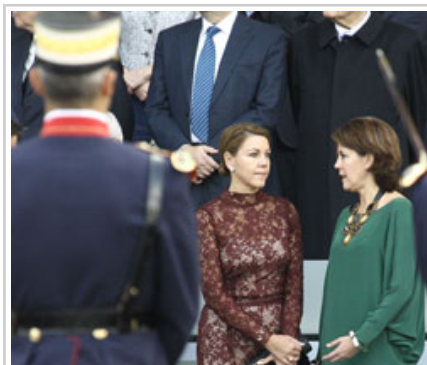
Yolanda Barcina Gaztela-Mantxako lehendakariarekin hizketan.