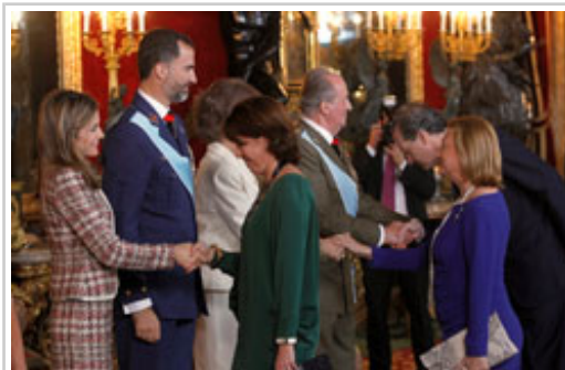
Barcina Lehendakaria Letizia Printzesarekin Erregeen Jauregiko ekitaldian.

Harrera ekitaldian, Yolanda Barcinak beste erkidegoetako lehendakariekin eta ekitaldira gonbidatutako gainerako agintari eta pertsonekin solasean egoteko aukera izan du.