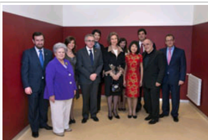
SM la Reina saluda representación OSN