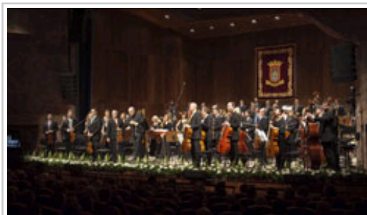
La orquesta saluda al término del concierto inaugural del Teatro Gaztambide