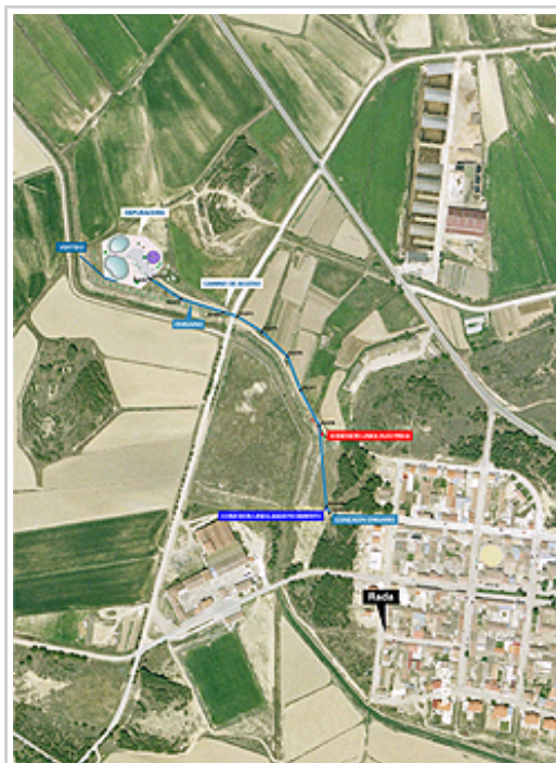
Fotografía aérea desde la que pueden observarse los bienes afectados por las obras.

La encargada de la definición del proyecto y de su construcción y explotación es la empresa pública Nilsa, adscrita al Departamento de Administración Local del Gobierno de Navarra. La nueva depuradora se basará en un sistema totalmente biológico, que incluye un decantador, un filtro biológico y dos lagunas finales, que sirven para retener caudal en momentos puntuales y como garantía de la calidad del agua final. Las lagunas ocupan 300 metros cuadrados y pueden retener el agua entre dos y tres días.