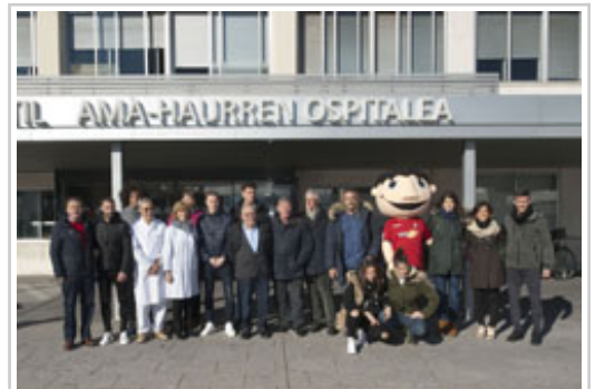
C.A. Osasuna taldeko zenbait jokalaria, beterano eta goi-kardudunak, maskotarekin, NOGen Unitate Pediatrikoko sarreran, ospitaleko langileekin batera

13:00ak aldera hasitako bisitaldian, jokalariai NOGeko hurren 4. eta 5. solairuetan izan dira, ospitaleratuta dauden neska-mutilekin solasean, autografoak sinatzen eta pazienteentzako jostailuak eta kirol materiala banatzen. Horrekin batera, lehenbailehen senda daitezela desiratu diete.